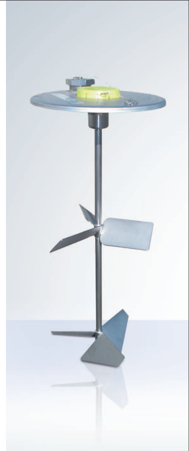
UCON IBCz Rührwerk für Flüssigkeiten. Rührwerk zum Reinigen herausnehmbar.