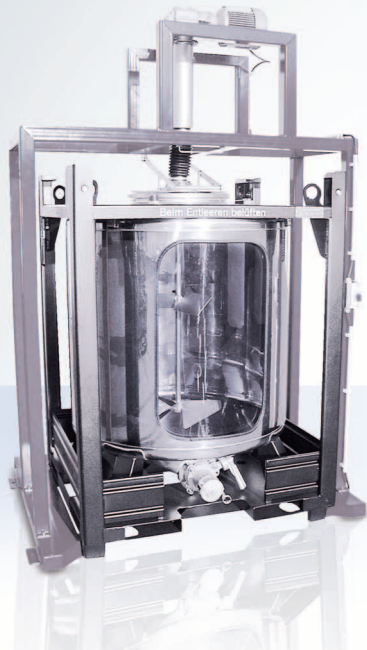
UCON IBCz Rührstation ist für kubische und zylindrische Container geeignet und besitzt eine spezielle Gelenkwelle zum Toleranzausgleich.