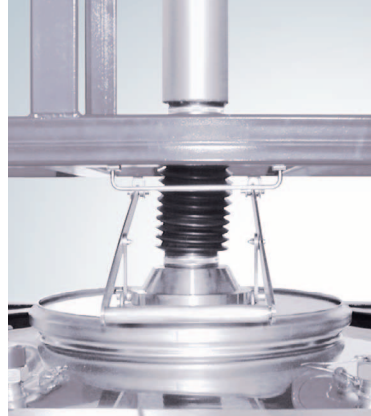
Rührstation im angekuppelten Zustand.