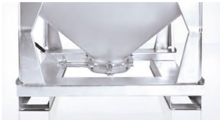
Auslauf: direkt am Flansch angeschraubte Absperrklappe mit Handhebel, 60° gekanteter Trichter, verschraubtes Untergestell mit durchgehenden Gabeltunneln.