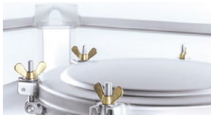
Mannlochdeckel in DN400 und Lebensmittel- bzw. Pharmakonform. Spannringdeckel oder Schraubdeckel mit Scharnier möglich.