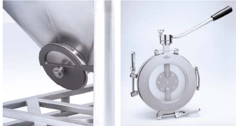
Auslauf mit speziellem Drehschieber oder Edelstahlklappe, wahlweise mit Scheibe aus Silikon