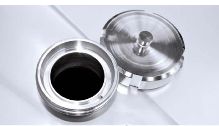
Be- und Entlüftungsstutzen