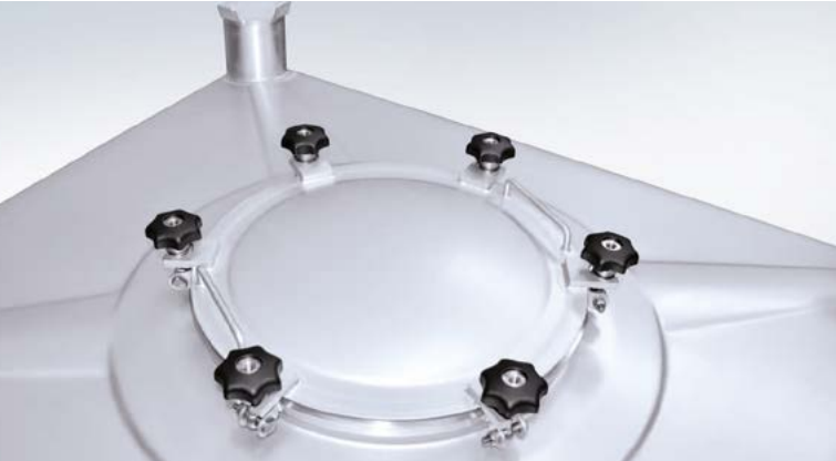
Schraubdeckel DN 400 lebensmittel- und pharmakonform