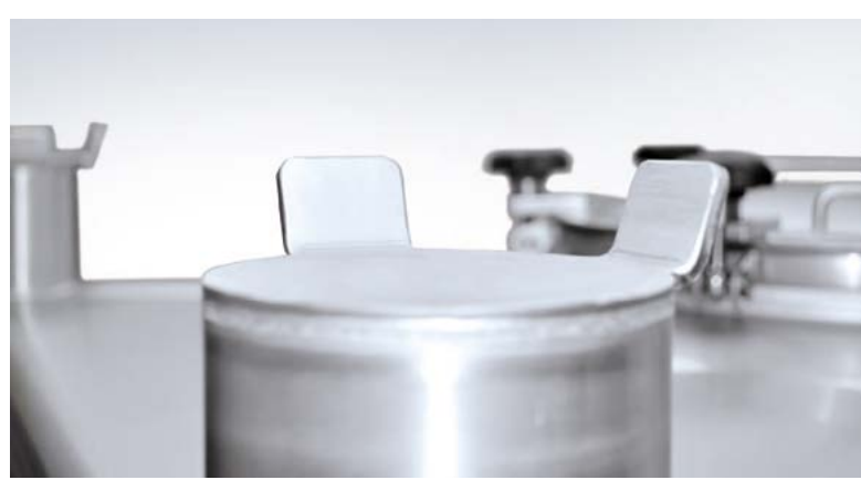
Oberboden mit Stapelecken